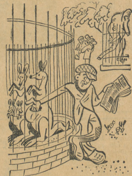
Kieszonkowiec przed kłatką kangurów nie może się powstrzymać, żeby nie sięgnąć do... kieszeni.

Dzierżawy składu klonialnego w powiecie morskim poszukuję. Pot: Adolphilster. 820.