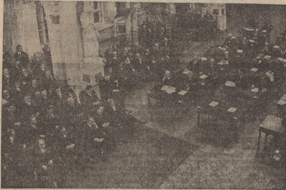
Na zdjęciu — ogólny widok sali Rady Miejskiej podczas posiedzenia.