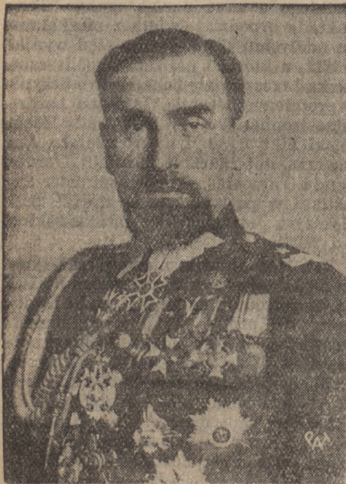
Nowomianowany komendant główny P. P. gen. Kordjan Zamorski, objął w ub. sobotę urząd.

mu przeciwdziałać i może stwierdzić, że w dużym stopniu udaje mu się to. Co się tyczy egzekucyj, to sprawa ta jest niezmiernie trudna, a to wskutek powstania olbrzymich zaległości. Oczywiście gdyby korpus sekwestatorów stał na wysokości zadania, dałby sobie niewątpliwie radę. Ale są to przeważnie urzędnicy mało płatni, niekiedy mało taktowni i mało wykształceni. Praca ich jest przykra i człowiek delikatny niechętnie na nią idzie. Oczywiście walkę podejmę z nietaktem w postępowaniu egzekutorów, gdy fakty te stwierdzą.