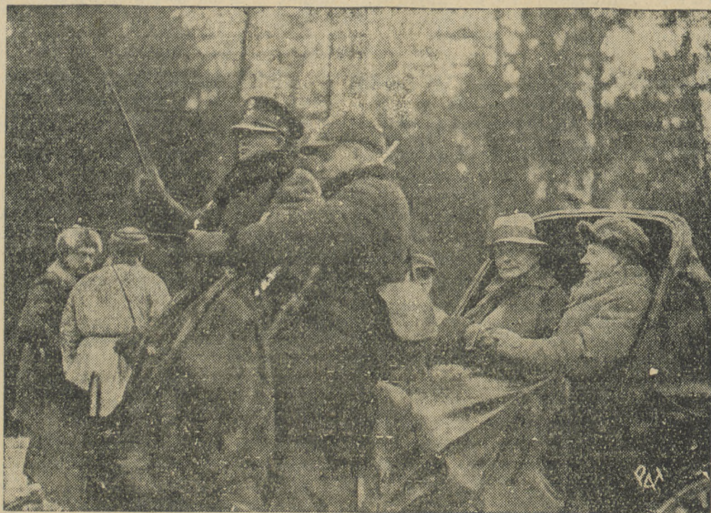
Na zaproszenie p. Prezydenta Rzplitej w reprezentacyjnym polowaniu w Białowieży wziął udział premier pruski p. Herman Goering. Na zdjęciu p. Prezydent Rzplitej w towarzystwie premiera pruskiego w. ki bitce w drodze na polowanie.