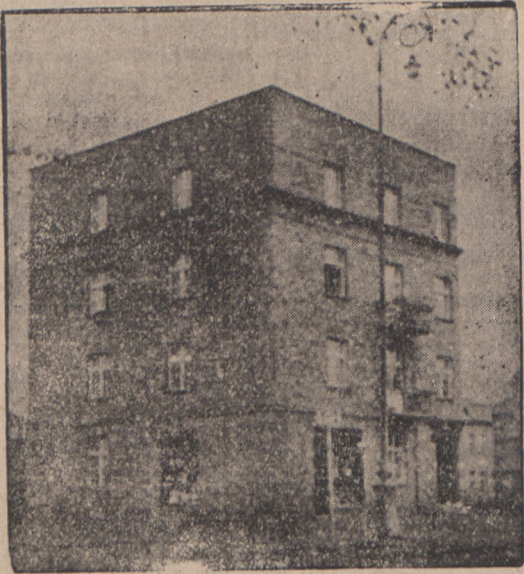
Nowa budowa naszego członka właśc. domu p. Piotra Kamińskiego, Tczew, Wybickiego 27, poż. zł 8.000,—