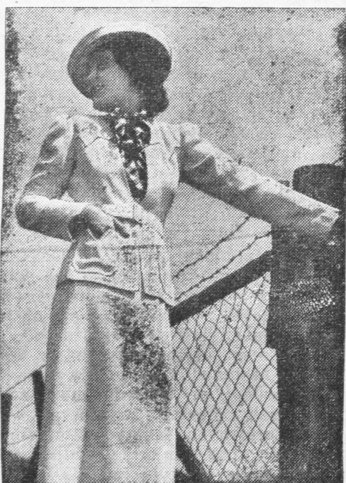
Wełniany kostium damski na chłodniejsze dni.

Najsukuteczniejszym środkiem na gąsienice na drzewach owocowych — jest Zieleni Paryska.