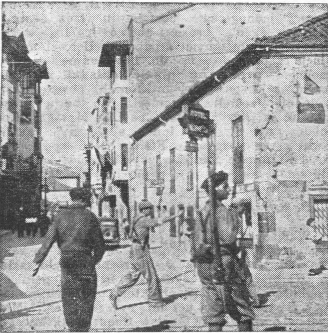
Hiszpańskie wojska narodowe w Reina podczas marszu na Santander. Posterunki narodowe na ulicy miasta.

Kapitan statku udał się na krótki pobyt do Algieru, skąd powrócił na pokład z grupą zwolenników narodowców hiszpańskich. Podczas gdy większość załogi, wieczorem otrzymawszy urlop, udała się na ląd, narodowcy opanowali statek, podnieśli kotwicę i pod osłoną nocy odплыли z portu. Do tej pory nie są jeszcze znane dalsze koleje statku, ale przypuszczają, że statek jest już w bezpiecznym miejscu.