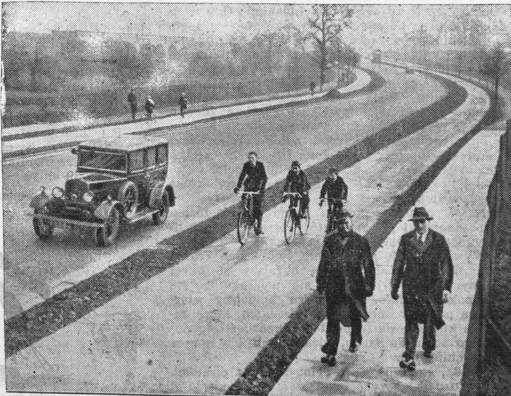
Główne szosy, prowadzące do Londynu, mają po bokach specjalne drogi dla rowerzystów

Takimi afiszami ostrzega się w Ameryce właściciele samochodów i szoferów przed skutkami lekkomyślnej i nieodpowiedzialnej jazdy