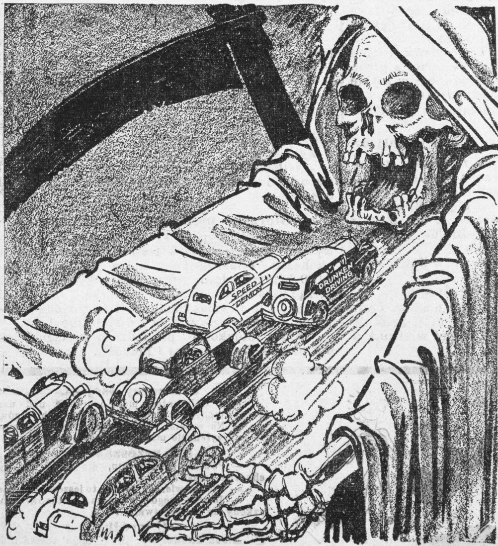
A LANE WITHOUT A TURNING

Głównym celem jest wypróbowanie urządzeń obronnych w Londynie. 460 samolotów brało udział w manewrach. 1 samolot bombowy spadł, 2 pilotów poniosło śmierć.