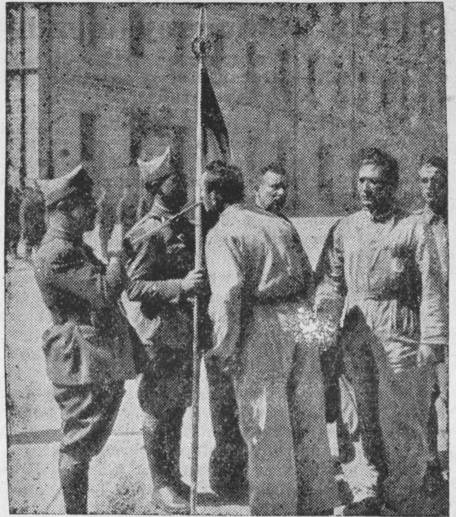
Zaprzysiężenie rekrutów wojsk narodowych w Hiszpanii. Są to oddziały ochotnicze, zgłaszające się do walk o narodową Hiszpanię.

rodziny katolickiej, myślą i uczuciem, które zwyciężają wszelką przestrzeń i czas. Na życzenia, złożone przez kardynała diekana, jako też napływające licznie z wszystkich stron świata, Papież odpowiedział najgorętszymi ojcowskimi życzeniami.