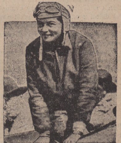
Znana pilotka niemiecka Elli Beinhorn zapadła bez śladu podczas lotu z Bagdadu do Busziru nad zatoką Perską. Samoloty perskich linii komunikacyjnych rozpoczęły poszukiwania za zaginioną pilotką. Elli Beinhorn odbywa lot do Indji i dalej na wyspę Bali.