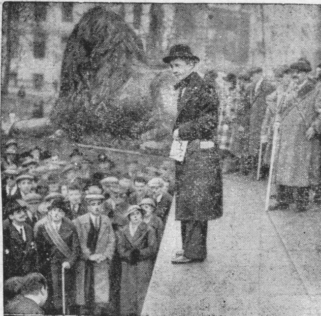
Związek ociemniałych w Anglii zorganizował marsz do Londynu, by starać się o poprawę swego bytu. Na jednym z placów odbyło się zgromadzenie i uchwalenie petycji do władz.

Porażona straszną chorobą gruźlicy krtani, zmarła po wielu męczarniach w listopadzie 1925 roku w Londynie, skąd ciało jej przewieziono do Edynburga.