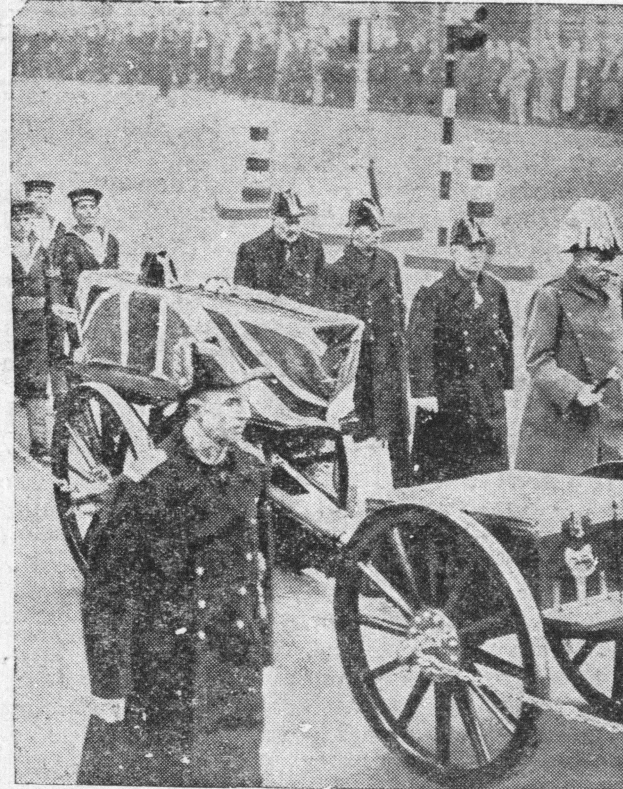
Pogrzeb admirała angielskiego Sir John Kelly. Lawetę ciągnął zwyczajem angielskim marynarze. Zwłoki jego po uroczystościach pogrzebowych w Londynie spuszczone do wody na pełnym morzu.