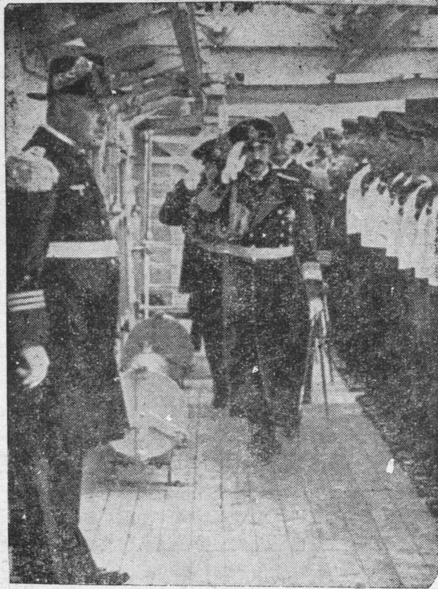
Bułgarski król Borys złożył wizytę na niemieckim krążowniku szkolnym „Emden“, który obecnie zatrzymał się w Warnie na Morzu Czarnym. Widzimy go przed frontem załogi.

Ostatnio prezydent Roosevelt dokonał uroczystego otwarcia olbrzymiego mostu, łączącego San Francisco z Oakland ponad zatoką. Właściwie jest to już dzisiaj jedno wielkie miasto o łącznej ludności 2 milionowej. Samo Oakland jest obecnie trzecim co do wielkości miastem w Kalifornii, liczącym 290.000 mieszkańców. Dotychczas komunikacja pomiędzy San Francisco, a Oakland utrzymywana była przy pomocy promów i statków. Wobec jednak szybkiego rozwoju obu miast okazała się konieczność szybkiej komunikacji ponad zatoką San Francisco. Zbudowano więc most, mający długość 17 km. Most posiada dwa pokłady. Na pokładzie górnym jest miejsce dla przejazdu 6-ciu obok siebie samochodów lekkich, trzech ciężarowych oraz dwie linie tramwajowe. Pokład dolny przeznaczony jest dla pieszych. Most ten przechodzi przez zatokę niejako dwoma skokami. — Pierwsza część jego: z San Francisco do wyspy, położonej w zatoce, ma 1,500 m. długości. W skale na wyspie przebito tunel i następnie poprowadzono most ponad otwartą zatoką. Budowa mostu kosztowała 77 milionów dolarów.