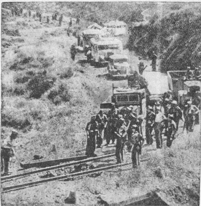
Kolumna samochodowa powstańców przepływa się przez wąwóz w drodze na Madryt.

Według otrzymanych tu doniesień rozpoczęła się już decydująca walka o stolicę Hiszpanii.