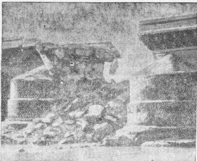
Wysadzony przez uciekających komunistów most w okolicy Sewilli.