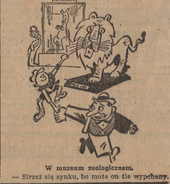
W muzeum zoologicznem. — Strzeż się synku, bo może on źle wypchany.

Okazyjnie do sprzedaży palto karaku- lowe w dobrym stanie ceną zł. 750, Zgłoszenia „Gazeta Morska”, Gdynia pod „O- kazja”, 11037