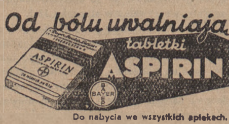
Do nabycia we wszystkich aptekach.