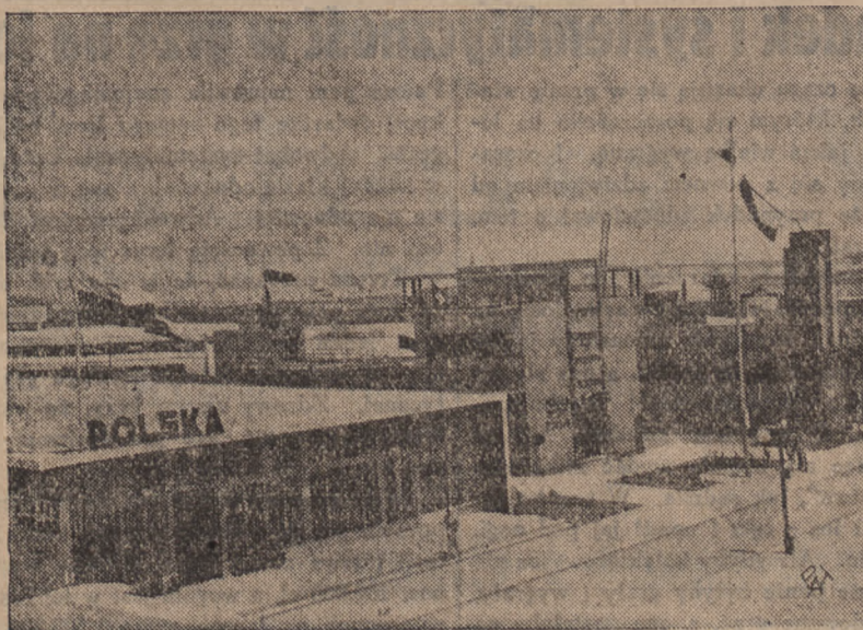
Pawilony polskie na targach lewantyńskich w T. el-Awiiw. Pośrodku pawilon łódzki.

Akcja ta jest już prowadzona, w porozumieniu z komisjami poborowymi, na terenie okręgu krakowskiego, w dniach najbliższych zaś zostanie zorganizowana również przez inne okręgi P. C. K.