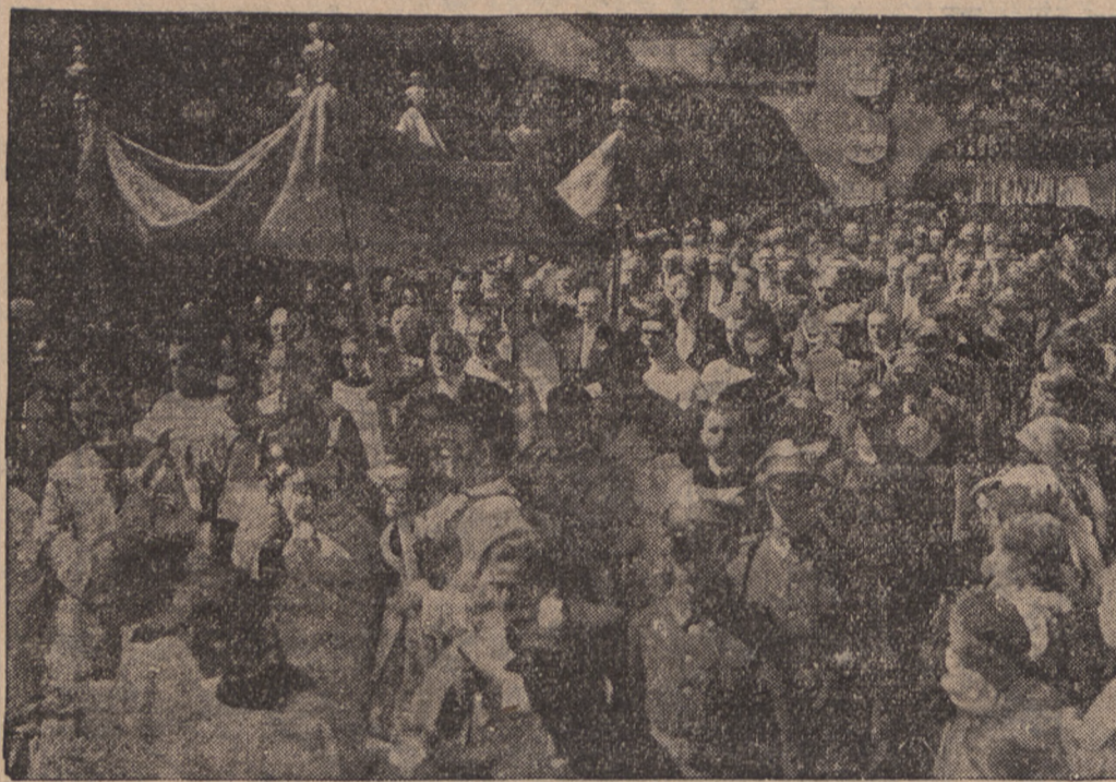
Jak donosiliśmy, w tegorocznej procesji Bożego Ciała w Krakowie wziął udział Pan Prezydent Rzplitej. Procesję prowadził ks. metropolita Sapieha. Zdjęcie przedstawia fragment procesji po wyjściu z katedry na Wawelu.