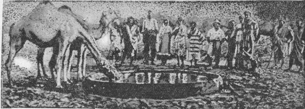
Na terenie Afryki wykopano wiele t. zw. studni artezyjskich. Studnie te tworzą bardzo ważne punkty strategiczne.

Genewa. Rządy Bułgarii, Islandji i Norwegii