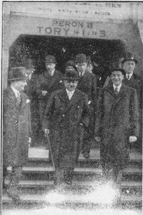
Na zdjęciu powitanie na dworcu w Warszawie. (Laval w środku, z prawej min. Beck).

Z pobytu Laval, min. spraw zagr. Francji, w Warszawie.