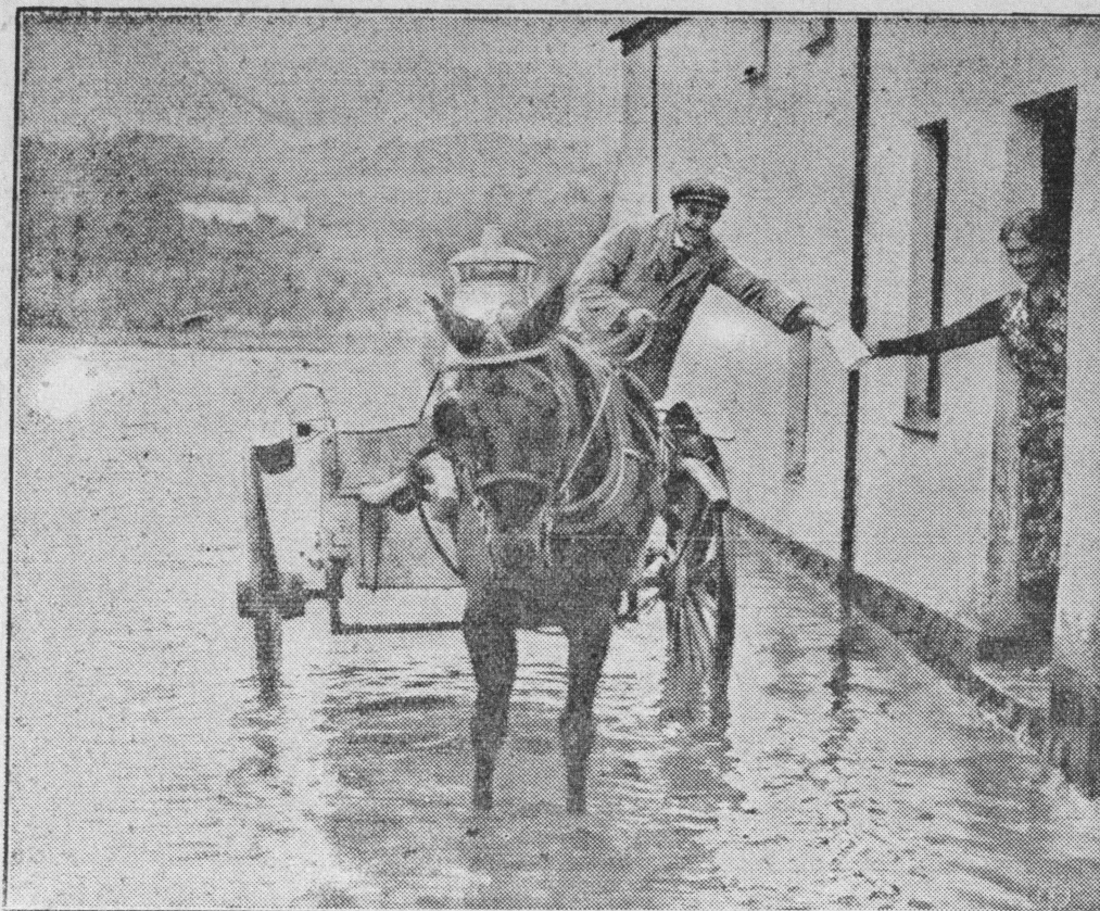
W hrabstwie Cornwall, w Anglii, spowodu deszczu powstała powódź. Sprzedawca mleka wprost z wozu zaopatruje swoich klientów w mleko.

W wyżej wymienionym okresie czasu wyjechało do Francji 7,392 osób, a wróciło stamtąd 16 658, do Niemiec wyjechało 343 osób, wróciło 220, do Stanów Zjednocz. wyjechało 1262 osób, wróciło 529, do Kanady wyjechało 1236, wróciło 396, — do Argentyny wyjechało 1725 osób, wróciło 707, — do Brazylii wyjechało 1880, wróciło 36, do Uru-