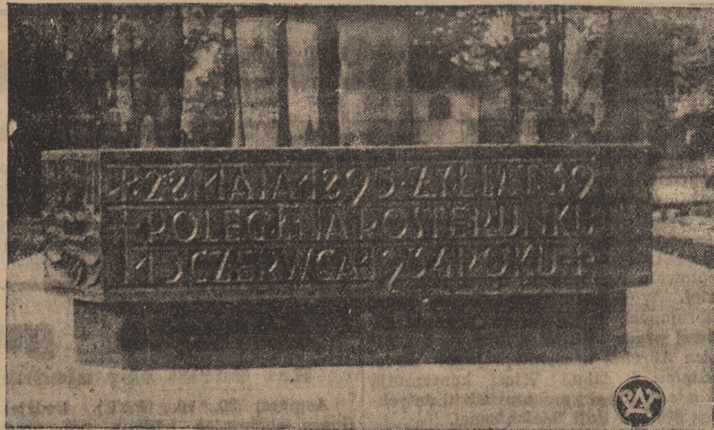
W sobotę dnia 19-go bm. odbyła się uroczystość żałobna przeniesienia trumny ś. p. Bronisława Pierackiego do mauzoleum. Na zdjęciu — mauzoleum ś. p. min. Br. Pierackiego.