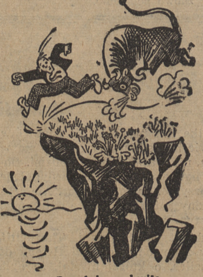
Decydująca chwila Teraz muszę się zdecydować, co lepsze: być terrorem czy skoczkiem.