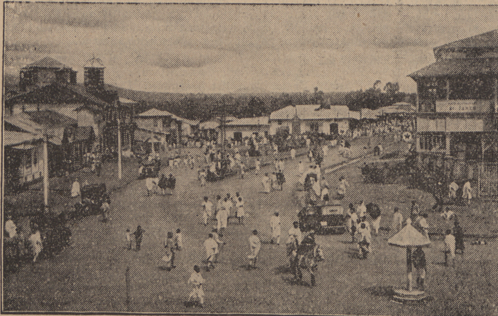
Na ilustracji jedna z głównych ulic Abisynji ulicą Ras-Mahonnen. Policjant (pod daszkiem) reguluje ruch uliczny.