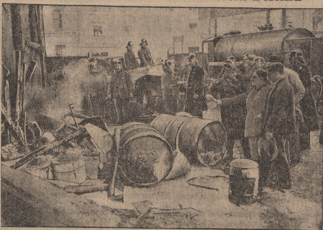
W śródmieściu Berlina eksplodowała przed pewną stacją benzynową beczka z benzyną, wzniesając groźny pożar, który jednak szybko ugaszono.