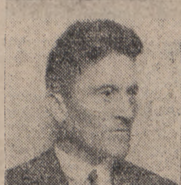
Mannheim G. 7. Nr. 42., d. 6. 4. 30. Wu.