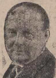
Berlin-Reinickendorf West Str. 20, Hs. 80. d. 21. 11. 30.

skoro fakty, które przytaczamy, dotyczące naszego od lat znanego środka odradzającego krew i wzmacniającego nerwy „FREGALIN“... Tysiące osób, które już wypróbowały „Fregalin“, nie zaznały zawodu.