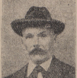
Niederwürzbach, Kreis Ingbert (saargebiet) d. 8. 9. 30.