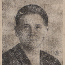
Fürstenhausen, Po. Völklingen Saargeb. Fürstenstr. 7, d. 5. 10. 30.

Moja żona cierpiała wskutek zupełnego nerwowego wyczerpania, była zupełnie zlamana...