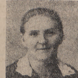
Weissenhorn (Schwaben) Muhlstrasse 1. dnia 6. 4. 30.