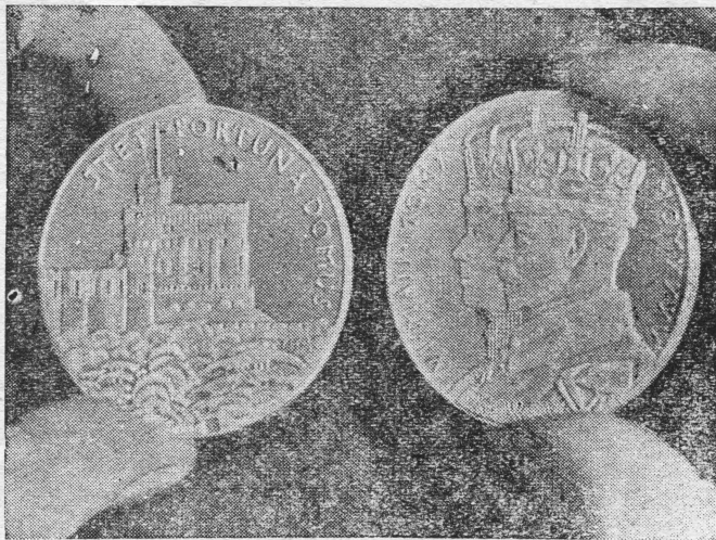
Z okazji 25-lecia objęcia tronu brytyjskiego przez Jerzego V wydano srebrne medale.

Po obiedzie oboje królestwo, podobnie jak i miliony ich poddanych, nastawiają radio i „łapią” koncerty z całego świata. Wówczas król siada w fotelu z gazetą i ze suniętami na nos binoklami, królowa zaś robi jakąś robótkę. Około g. 11-ej udają się na spoczynek.