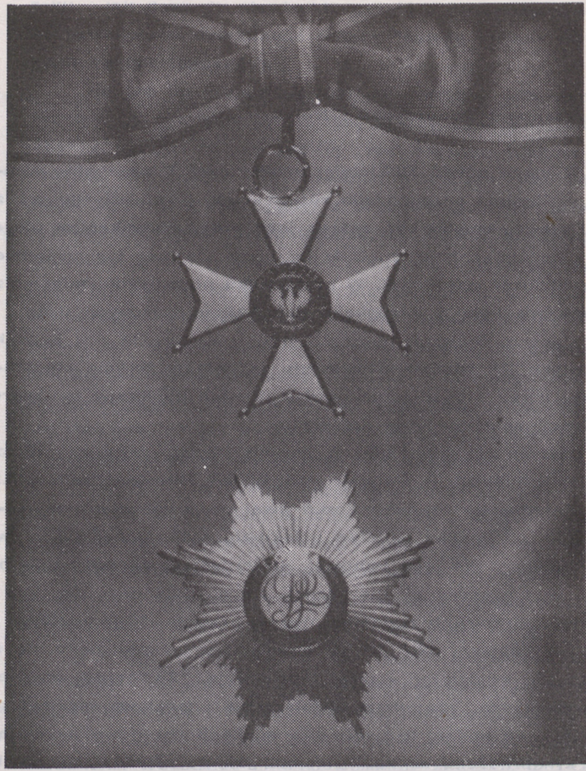
Krzyż Komandorski z Gwiazdą Orderu Odrodzenia Polski, przy- znany Towarzystwu Naukowemu w Toruniu przez Radę Państwa w dniu 21 lipca 1976 r.

WYSTĄPIENIE PRZEWODNICZĄCEGO RADY PAŃSTWA PRZEZ DRA HENRYKA LABIŃSKIEGO