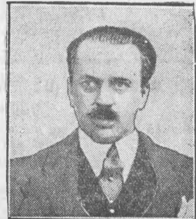
Hr. Al. Skrzyński

b. premier wygłosił w dn. 28. ub. m. w Paryżu w sali Instytutu Carnegiego odczyt na temat: „Nacjonalizm i idea międzynarodowa“.