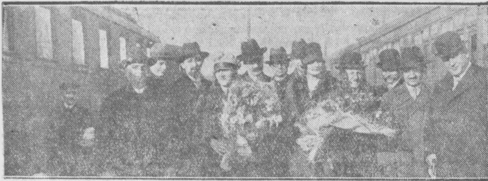
Dnia 22 b.m. przybyli do Warszawy wybitni prawnicy rumuńscy.