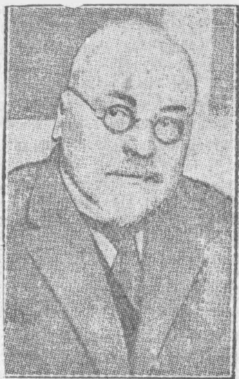
Nowy Prezydent Łotwy, Gustaw Sengals.

Memphis, 27. 4. Na skutek przerwania szeregów tam, szef dalszych miast w stanach Arkansas Missisipi zostało nawiedzonych powodzią. Liczba pozabawionych dachu nad głową wzrosła do 200 tysięcy; liczba zabitych oceniana jest na 500. Obszar nawiedzonych powodzią wynosi obecnie 9 500 mil kwadratowych.