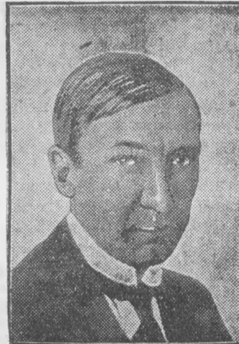
Aleksander Kiereński, premier i głównodowodzący wojskami rewolucyjnymi. Był pośrednio przyczyną śmierci Cara Mikołaja.

Niebywały przepych wystawy! Mistrzowska reżyserja! Rekonstrukcja Pompei wraz z słynnym cyrklem! Walki gladiatorów. Groźny wybuch wulkanu i trzęsienie ziemi. Część zdjęć w kolorach naturalnych. Film ten wystawiony kosztem 2.000.000 dolarów jest produkcją 1926 r. będzie kulturalnym pomnikiem całego cywilizowanego świata i spodziewamy się, że społeczeństwo tutejsze nie ominię tego tak wysoko cennego przedstawienia. Obie serie będą razem wyświetlane.