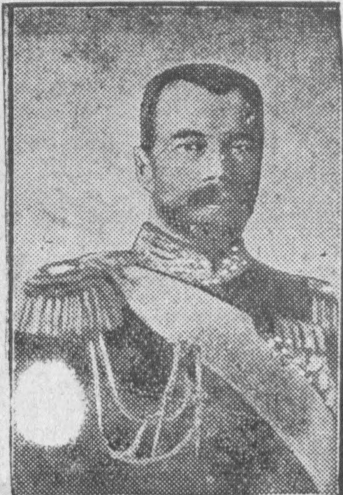
Car Mikołaj II. zamordowany przez bolszewików na Syberji.