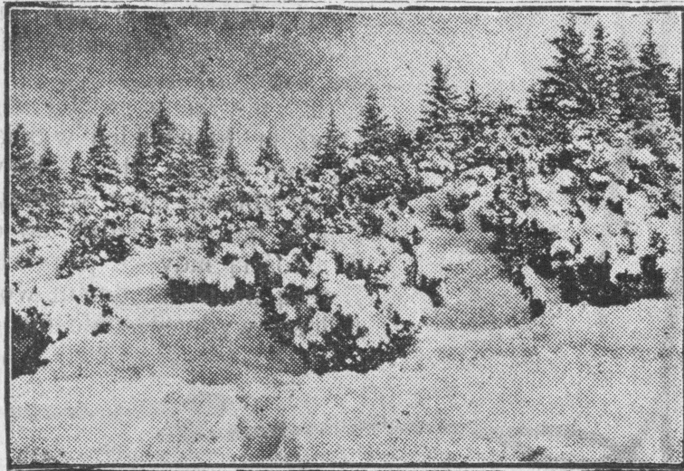
Piękna szata zimowa w halach Tatrzańskich.