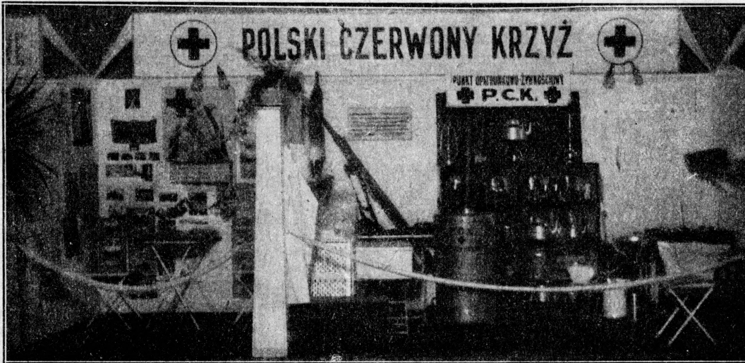
Wzorowo urządzony punkt opatr.-lecznic. P. Cz. K. oraz dział propagandowy ilustrujący poszczególne zadania i prace T-wa.

Z inicjatywy Tow. Doraźnej Pomocy Lekarskiej w Warszawie, zwanego popularnie „Pogotowiem Ratunkowym”, została zorganizowana przy współudziale i celów instytucji humanitarnych, biorących udział w wystawie. Równocześnie należy podkreślić zwrócenie ze