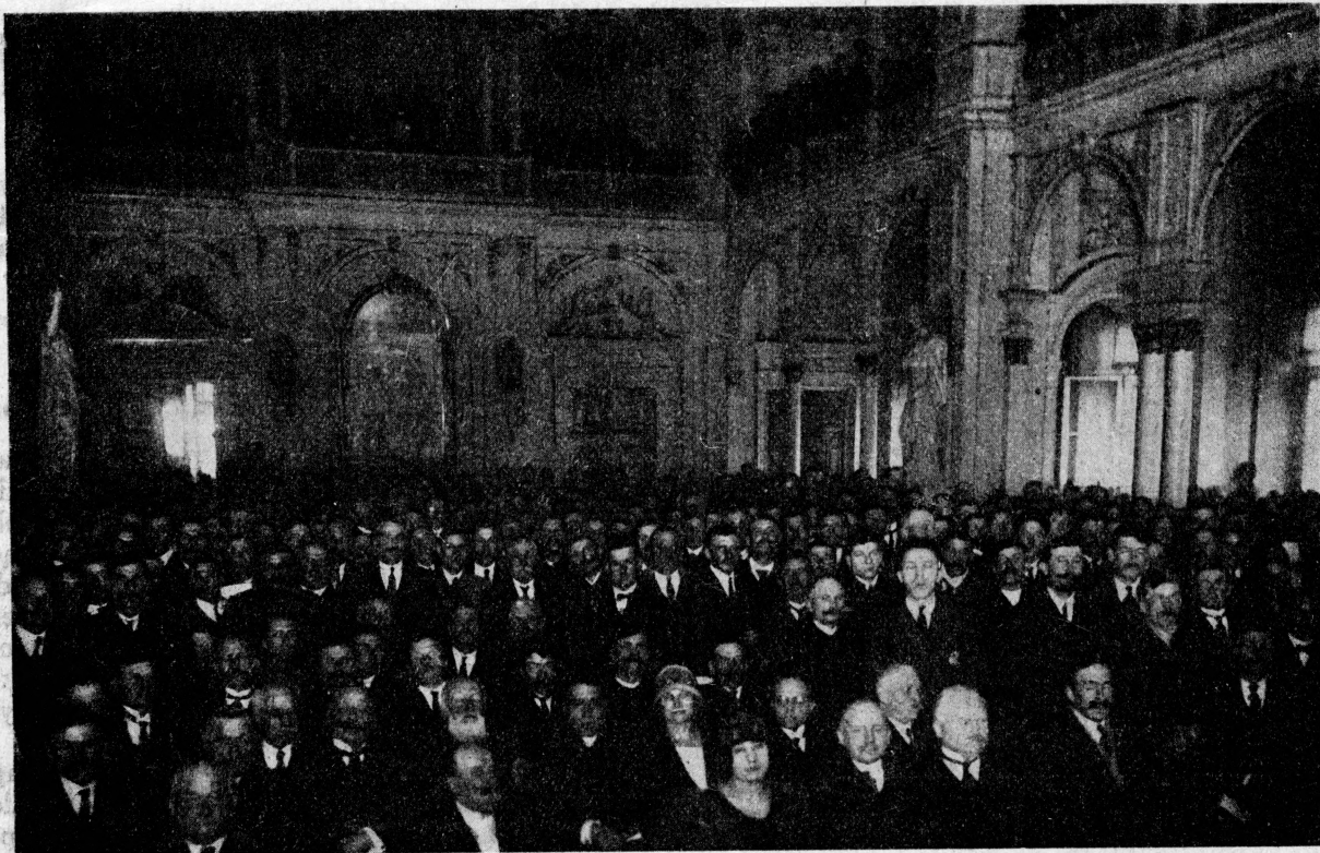
Sala Obrad Rady Miejskiej w czasie zjazdu.

Z powodu tak olbrzymiego zjazdu, wielka Sala C. T. R. okazała się zbyt małą dla obrad, to też przeniesiono je do gmachu Rady Miejskiej i tam z trudno-