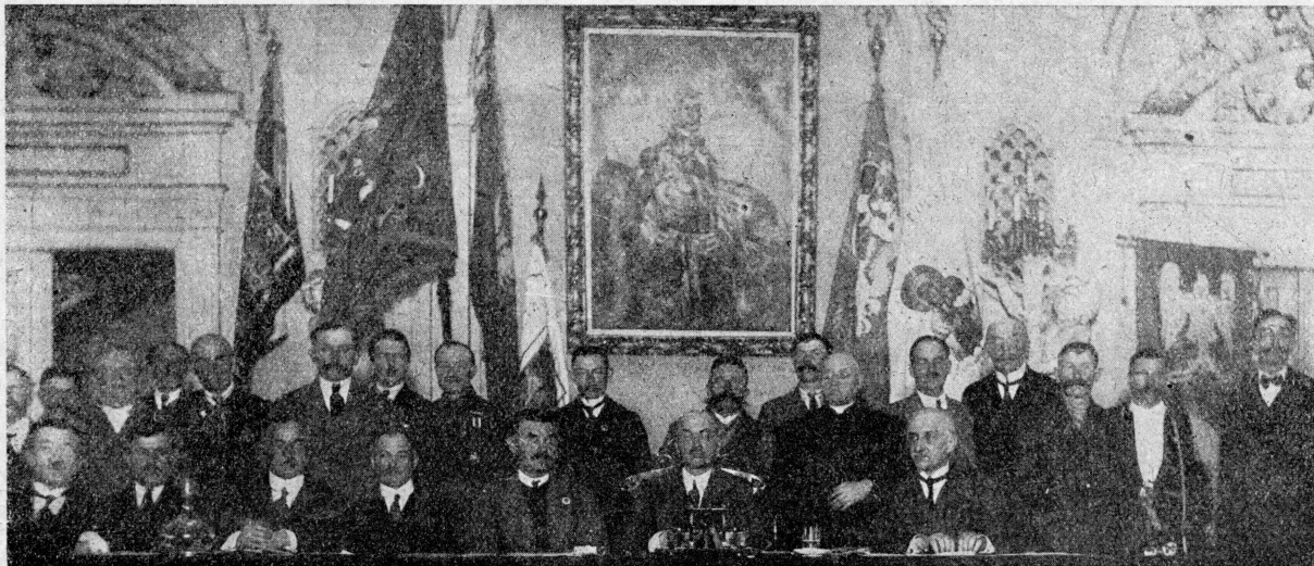
PREZYDJUM ZJAZDU KÓŁEK ROLNICZYCH C. T. R.