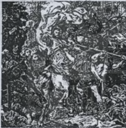
FRAGMENT Z OBRAZU „GRUNWALD” JANA MATEJKI

W ROKU 1410 dnia 15 lipca, połączone wojska polskie, litewskie, smoleńskie, kijowskie, czeskie i morawskie, silne swoją jednością stoczyły na polach Grunwaldu zwycięski bój z śmiertelnym wrogiem Szwabszczyzny — krzyżakami.