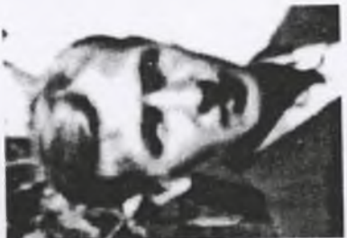
35. kpr. Tadeusz BACZYŃSKI ps. "Teddy"