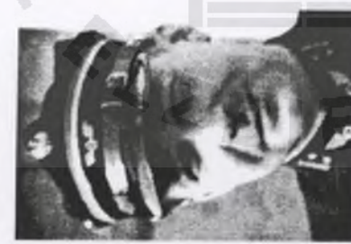
150. Zbigniew SZCZERKOWSKI ps. "Łos"