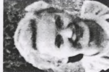
98. Krystyna KRZESIŃSKA ps. "Kruszyna"