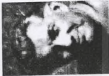
28. por. Aleksander SZYMAŃSKI ps. "Andrzej"