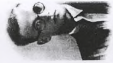
87. pchor. Lech KIL- CZYK ps. "Krzych"