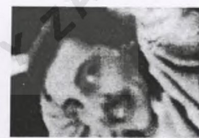
161. Ignacy WENC ps. "Wsypta"