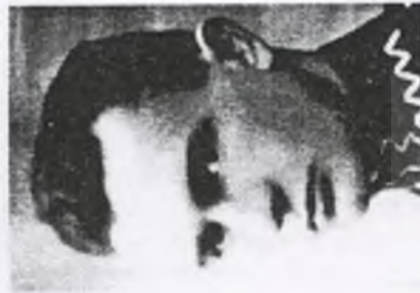
100. st. sierż. Lucjusz KURCZYŃSKI