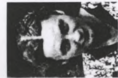
181. Sabina Alwastówna, TON