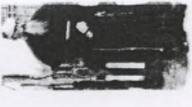
90. Maksymilian KOLBE ps. "Korajma"