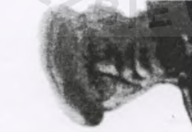
113. st. sierż. Wacław MAJ-DYKOWSKI ps. "Lubiec"