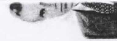
15. por. Sto BOWSKI ps.