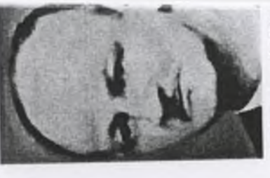
36. Kazimierz BACZYŃSKI ps. "Mściwy"