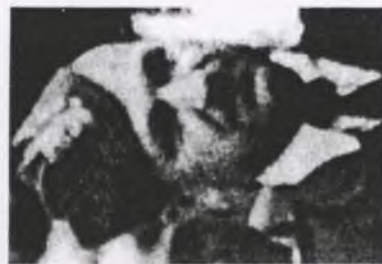
7. por. Roman WYKUSZ ps. "Gustaw"