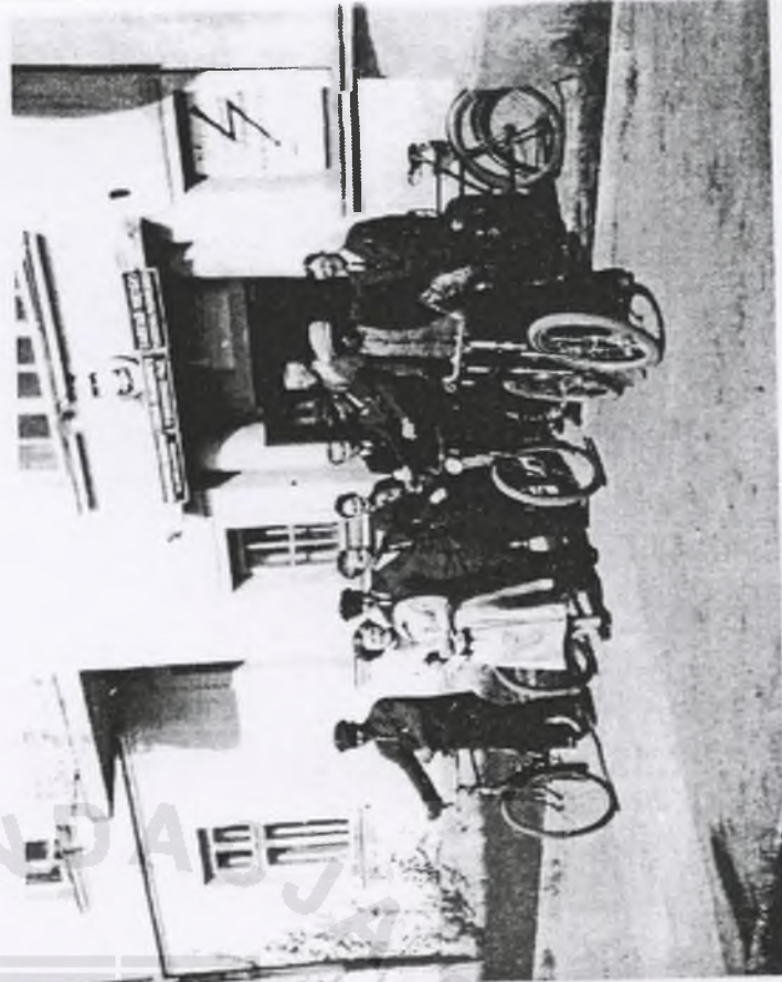
193. Pracownicy Magistratu przed siedzibą Urzędu, przy ulicy Klimskiego 8 — 1939 r.