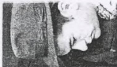
102. pchor. Bogdan KWISIEWICZ ps. "Broniek"