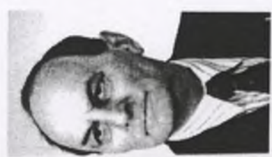
157. Stanisław STĘPNIĄK ps. "Zaremba"