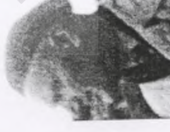
178. plut. Władysław ŻELAZ- KO ps. "Żelbet"