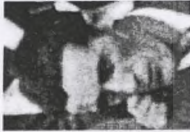
111. Tadeusz ŁAGAN ps. "Zoska"