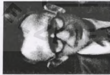
5. kpt. inż. Wacław KONA- RZEWSKI ps. "Stanisław"