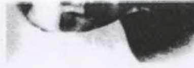
18. Tadeusz ps. "Konrad"