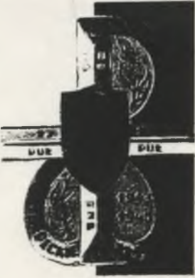
ZMOD. PROJ. W. SNIADECKI