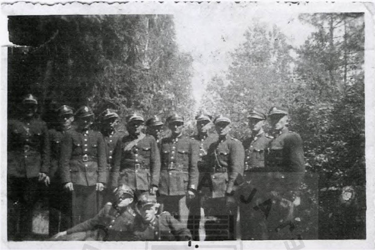
OSP Płużnica, lata 40te