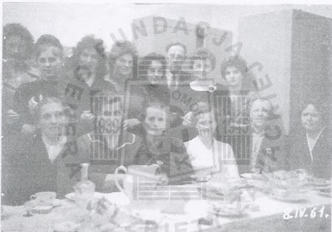
Koło Gospodyń Wiejskich w Płużnicy, 1961 rok