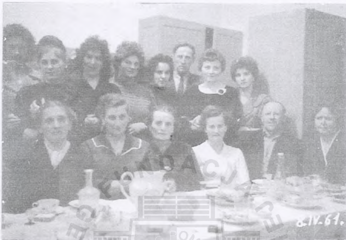
Koło Gospodyń Wiejskich w Płużnicy, 1961 rok