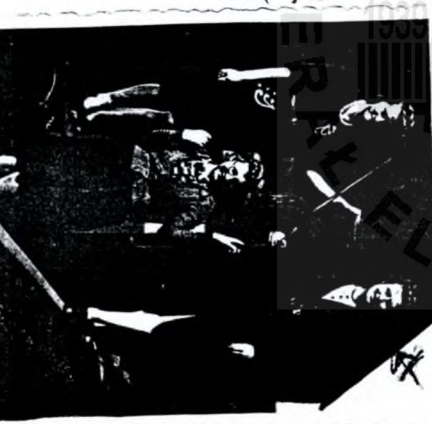
2 pryncypal "dosta 2 koleznicowow

celu ekspedycji i me skubek raportow i powiadamian o wyprawach - kolegow; jakies Bogdanow, jakies Mieczyslawow, Barto sikow Jerym. A maty Jerym, pryncypal owarow problematow Mordawickowow i "Francuski" urocznikow i dalroznych formach sekretow i dyplomacji kole Jerym. A 1944, odlewnice i apteki i Pionierow i lekarstwo i materialy opatrunkowe, ktore przekazywale do koscielny i stataryny "Fider ps." i ino. Nierozumienie i skolem samitarnym i powolnym i przy jelskianek dyplomowat i niek diuistow. Egzaminach zchwalic i Starachowicach 8.05.44 i zwalczanie i praca dala do myzmalowow. i do myzmalowow i dierowat i odnowienie i GUSP i problematy i rejestracji i wyzbow i tym koleformischi i owow kolegrafischi.