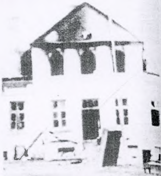
zędu Bezpieczeństwa Publicznego w Hrubieszowie.