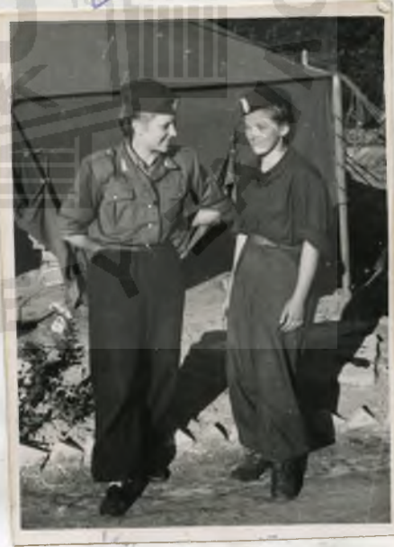
Warszawa 1945 VII/1