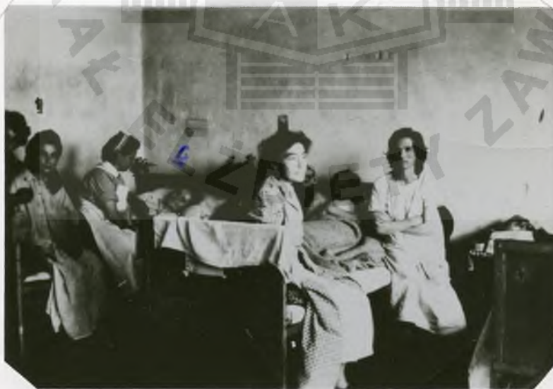
Berger - Belsen, czerwiec 1945r. Szpital niem., blok 43