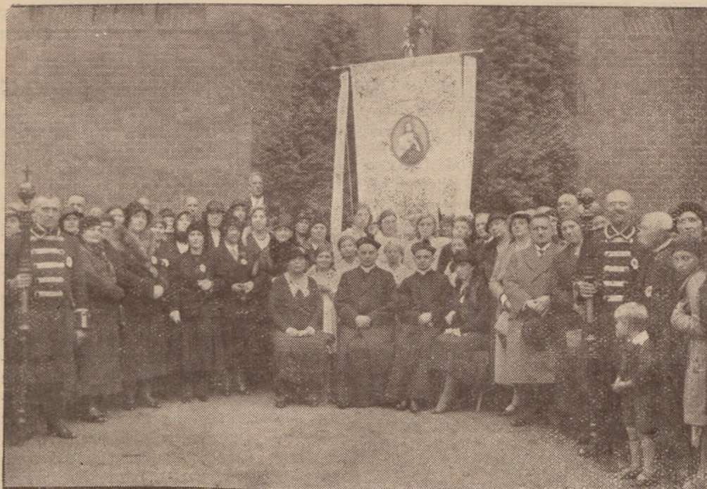
Uroczyste poświęcenie sztandaru Straży Honorowej Najśw. Serca Pana Jezusa w naszej parafji.