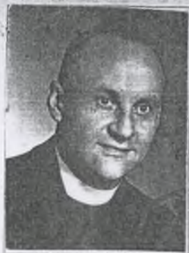
Signature of bearer