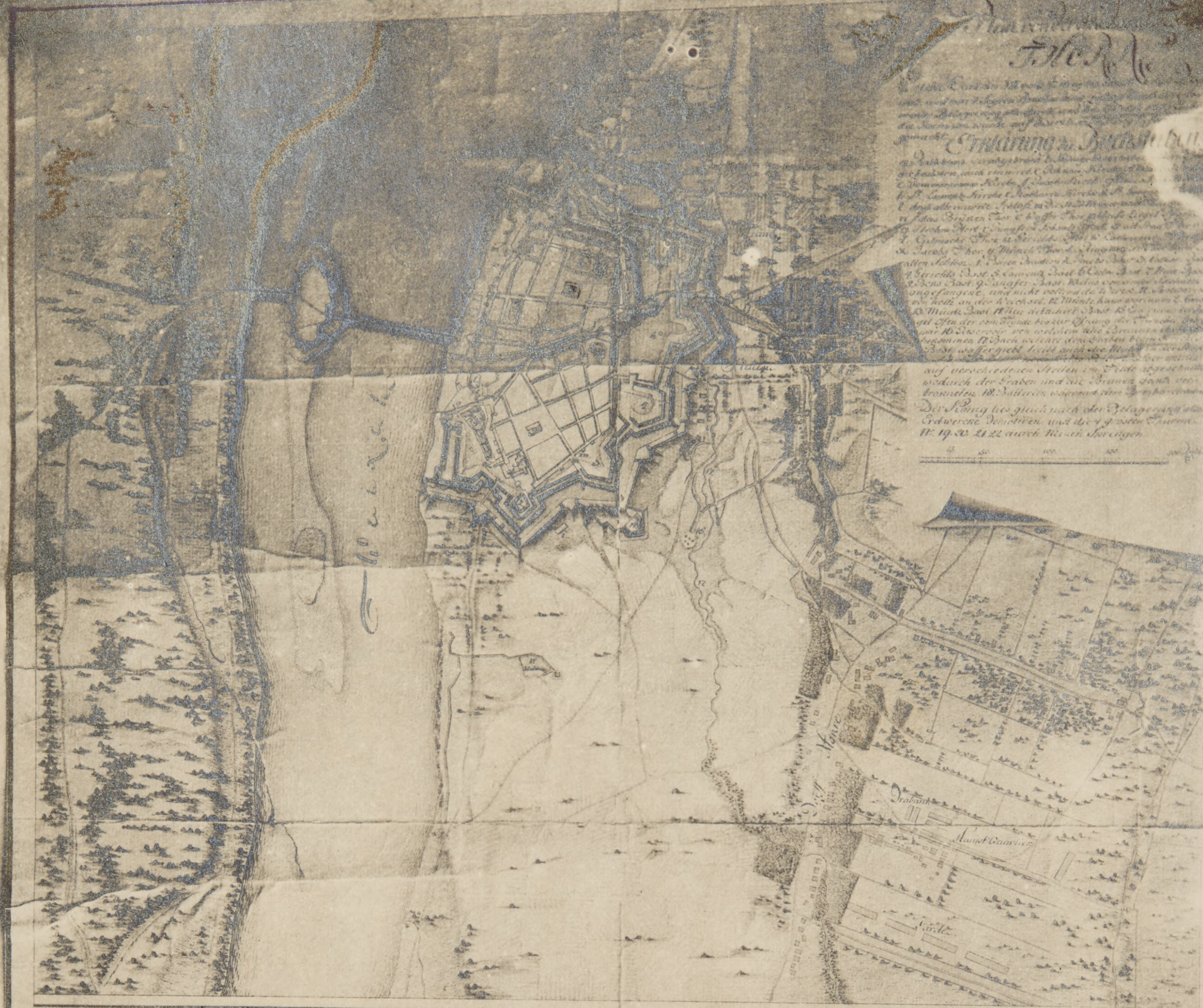
Profil vom Bastion N. 4 nebst der Stadt-mauer und Graben.

Die Zeichnung zeigt die Festung Thorn, die im Jahr 1794 durch die Franzosen erobert wurde. Die Zeichnung ist in drei Theile getheilt: oben die Festung selbst, in der Mitte ein Profil der Festung, unten eine Ansicht von der Stadt Thorn. Die Festung ist ein Viereck mit vier Bastionen. Die Stadt Thorn ist in zwei Theile getheilt: die Altstadt und die Neustadt. Die Altstadt ist die alte Stadt, die Neustadt ist die neue Stadt, die im Jahr 1794 erbaut wurde. Die Zeichnung ist in drei Theile getheilt: oben die Festung selbst, in der Mitte ein Profil der Festung, unten eine Ansicht von der Stadt Thorn.