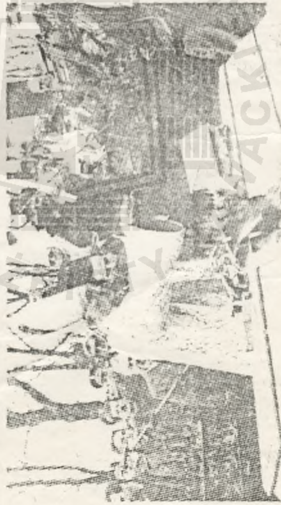
Na warszawskim cmentarzu na Powązkach.