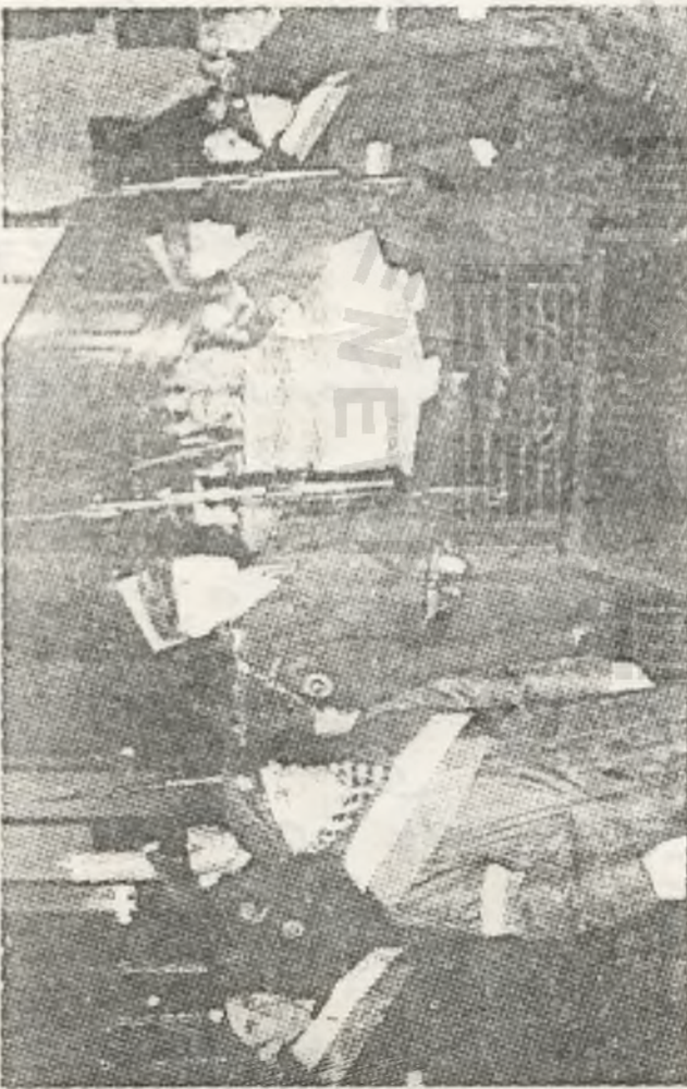
Uroczystość w bazylice archikatedralnej.