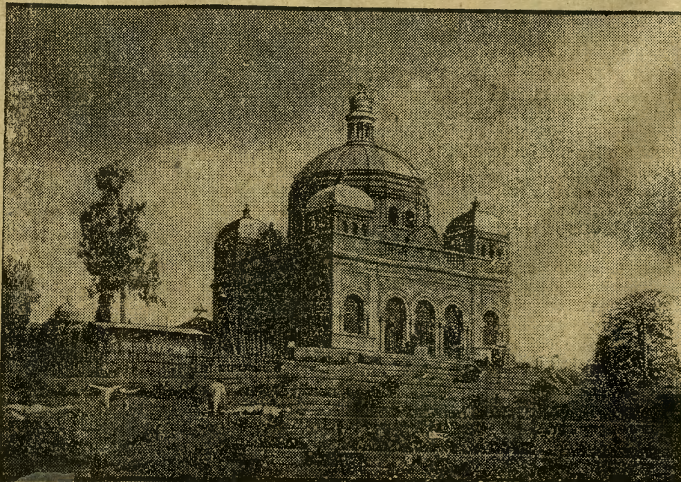
Na miejscu dawnego pałacu Gilei — rezydencji cesarzy abisyńskich — wznosi się mauzoleum cesarza Menelika.