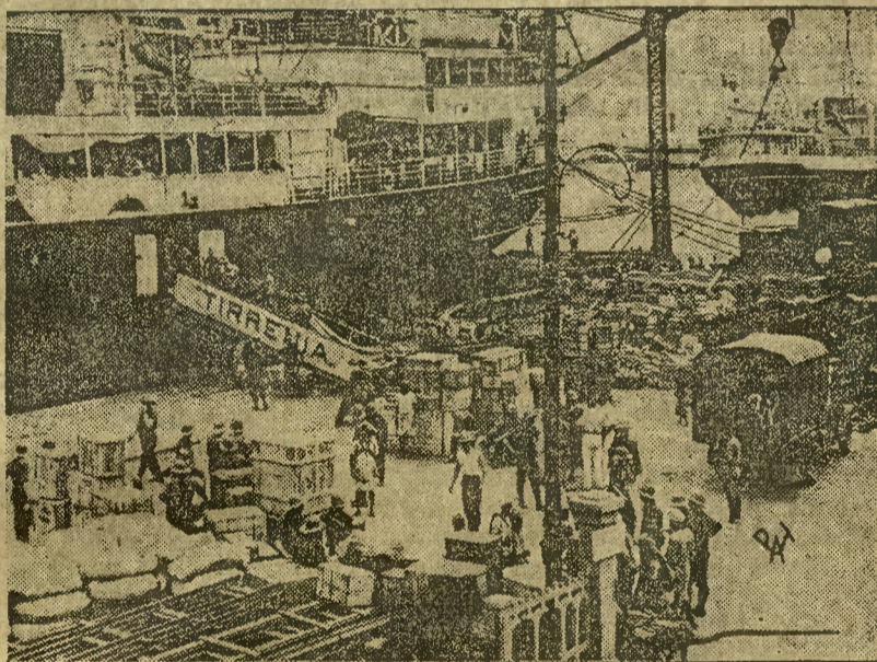
W porcie Massawa, w kolonii włoskiej Erytrei widać gorączkową pracę nad wyładowaniem i magazynowaniem zapasów amunicji, sprzętu wojennego, zapasów żywności i środków opatrunkowych.