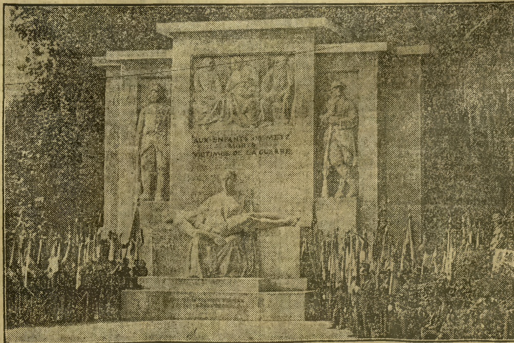
Ubiegłej niedzieli prezydent Republiki Francuskiej Lebrun dokonał w Metz uroczystego odsłonięcia pomnika poległych w czasie wojny światowej. Fronton pomnika widzimy na zdjęciu.