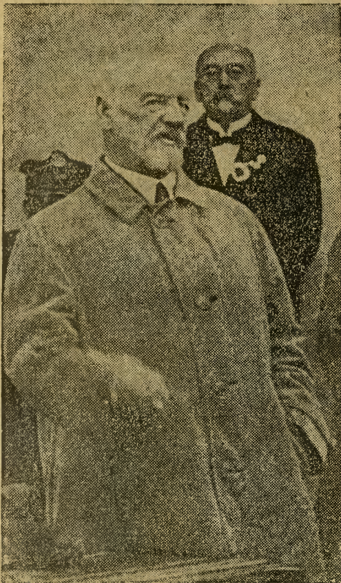
Na zdjęciu gen. L. Żeligowski, prezes Komitetu Organizacyjnego podczas przemówienia.