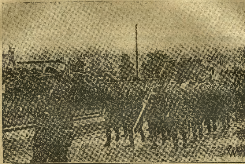
W 15-tą rocznicę bitwy pod Warszawą, na polach radzymińskich odbyła się uroczystość dla upamiętnienia wielkiego dnia w historii Polski i oddania hołdu poległym bohaterom. Na zdjęciu 1. Fragment defilady przed przedstawicielami Rządu, Związku Rezerwistów.

W województwie Pomorskiem i Poznańskiem w związku z panującymi upałami zanotowano kilkadziesiąt wypadków utonięcia w czasie kąpieli. Jak donosi prasa gdańska według nieoficjalnego obliczenia w ciągu ostatniego sezonu utonęło przeszło 100 osób. Ciekawy jest fakt, iż prasa gdańska zapatruje tę wiadomość tytułem: „Ueber hundert Personen im Korridorgebiet ertrunken“. (Przeszło sto osób utonęło na terenie korytarza).