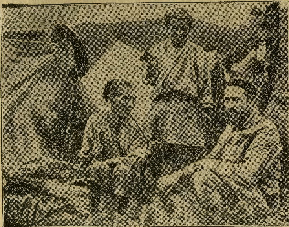
Niedawno przybyła do Azji ekspedycja mnichów z „St. Bernhard”, która ma zamiar założyć w Himalajach schronisko i stację ratunkową, na wzór istniejących w Alpach. Oto pierwsze zdjęcie, jakie nadeszło z Azji do Europy, na którym widzimy jednego z mnichów w towarzystwie dwóch tybetańczyków, z którymi prowadzi rozmowę w sprawie zwózki materiałów budowlanych na budowę schroniska.