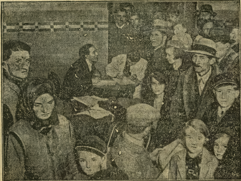
We wczorajszym numerze donieśliśmy, że na węgierskie stacje pograniczne przybywają tysiące wydalonych Węgrów z Jugosławii. Oto pierwsza fotografia wysiedleńców, węgierskich, którzy przybyli do Budapesztu. Znaleźli oni tymczasowy przytułek w domu ludowym.