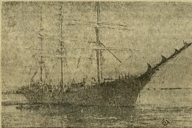
Jak donosił polski statek szkolny „Dar Pomorza” wyruszył w ub. niedzielę na całoroczną podróż naokoło świata

kurencyjnej na rynkach światowych, oraz o opanowanie społecznych i gospodarczych skutków kryzysu.