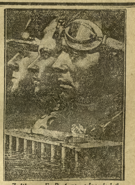
Z filmu: „F. P. 1 nie odpowiada”