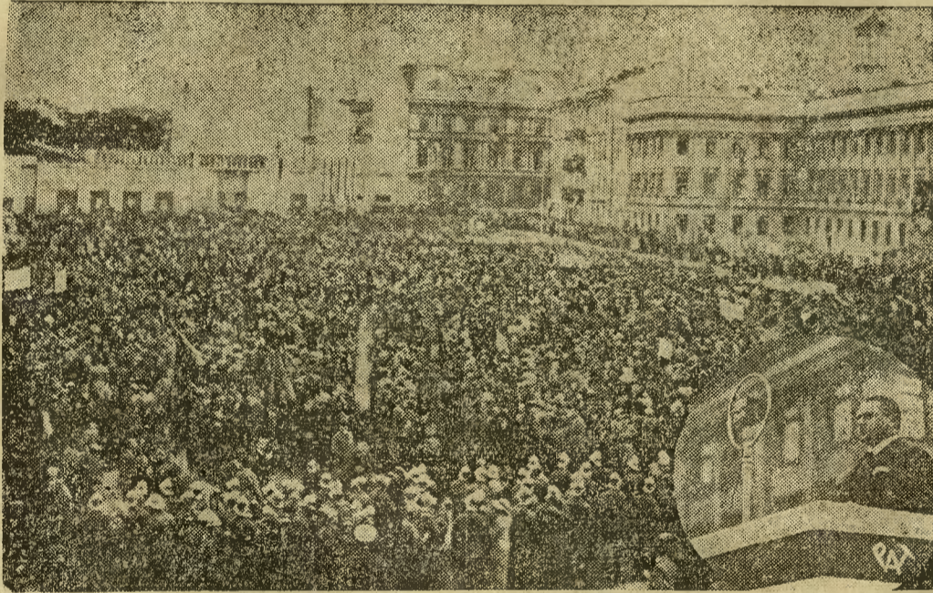
Na zdjęciu tłumy na placu Piłsudskiego; w owalu prezydent m. st. Warszawy Stefan Starzyński przed mikrofonem, transmitującym przebieg manifestacji.