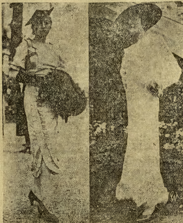
Dwie kreacje mody paryskiej na wyścigach w Arteil