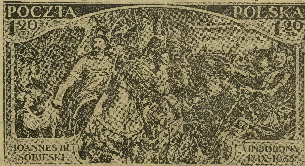
Nowy polski znaczek pocztowy, wydany ku czci króla Jana Sobieskiego z okazji 250-iej rocznicy odsieczy Wiednia. Rysunek przedstawia fragment obrazu Jana Matejki „Odsiecz Wiednia” z główną postacią króla Jana Sobieskiego na pierwszym planie. Znaczek tłoczony jest w kolorze ciemno-niebieskim z odcieniem fioletowym. W sprzedaży ukaże się po raz pierwszy w dniu obchodu rocznicy, t. j. 12 września b. r.