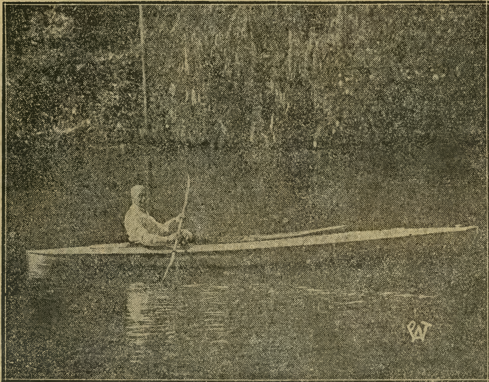
Pan Prezydent Rzeczypospolitej na przejażdżce kajakiem po Pilicy w swej letniej rezydencji w Spale