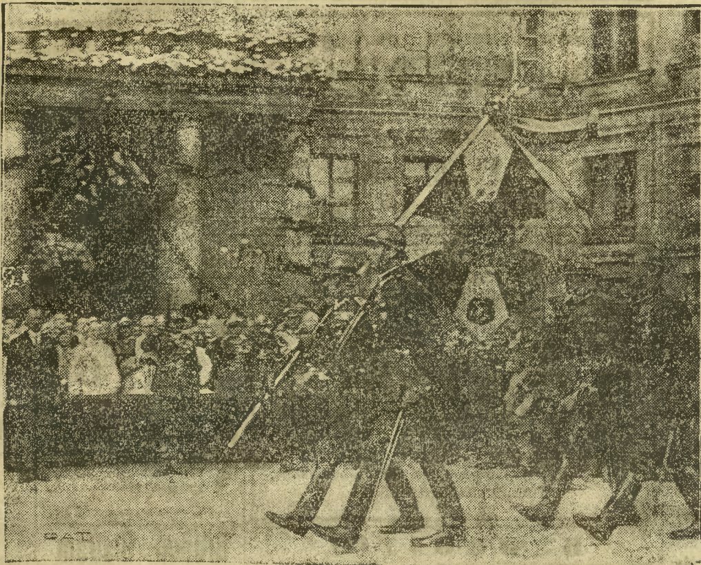
Miasto stoł. Warszawa i 21 warszawski pułk piechoty świętują dnia 18 bm. uroczystość wręczenia pułkowi „Dzieci Warszawy” nowego sztandaru. Na ilustracji naszej widzimy poczet sztandarowy, przechodzący przed frontem pułku. Na fotografii widoczni są (od prawej): gen. Fabrycy (1), plk. Dojan-Surówka (2) bis kup Gall (3) i prezydent Stomiński (4)