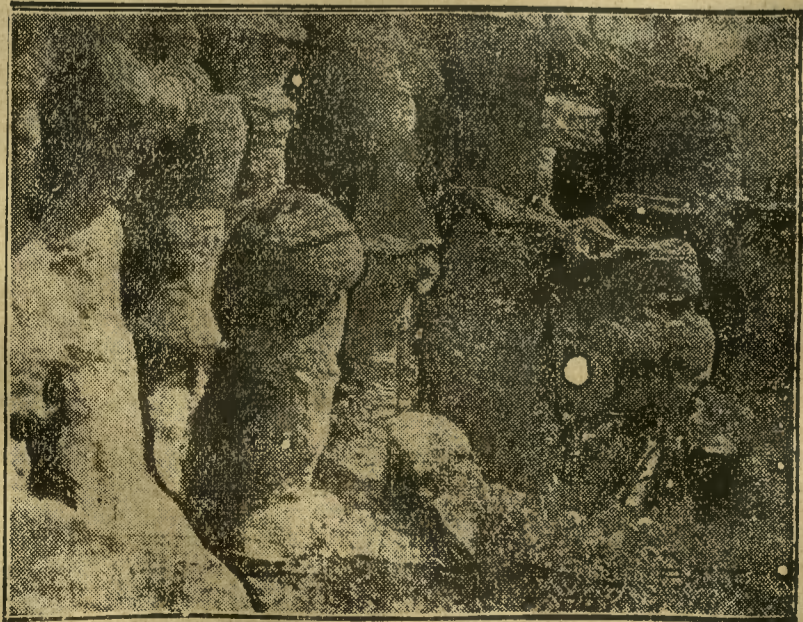
Godną widzenia osobliwością są pieczary w Mechowej w okolicy Pucka. Na fotografii naszej widzimy fragment tego oryginalnego tworu geologicznego.