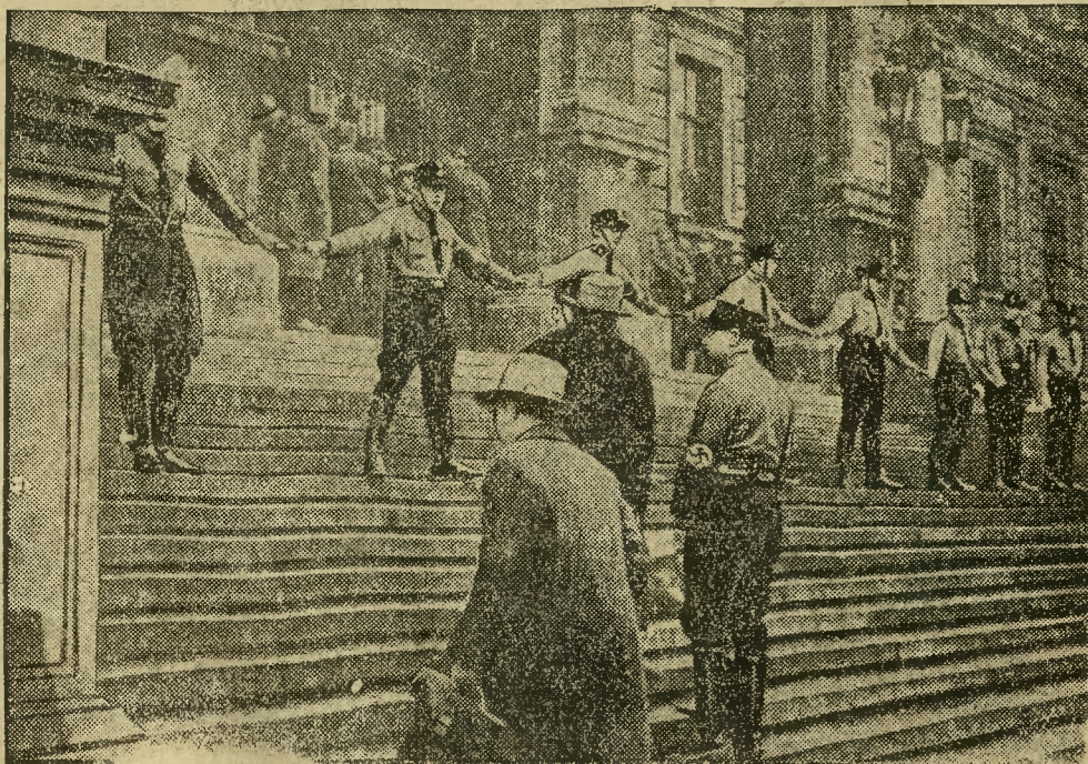
Na wyższych uczelniach w Wiedniu doszło ostatnio do gwałtownych starć, między studentami nacjonalistycznymi i lewicowymi. Studenci nacjonalistyczni zamknęli przy pomocy swych kolegów w mundurach główne wejście do uniwersytetu aby swym przeciwnikom uniemożliwić dostęp do sal wykładowych.