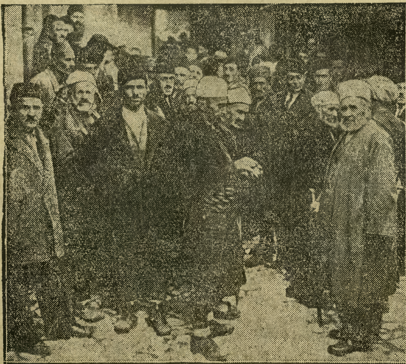
W dniu 8 listopada b. r. odbyły się w Jugosławji wybory do Izby Ustawodawczej. Liczba głosujących na listę narodową, wysuniętą przez rząd, przewyższyła liczbę głosujących wszystkich innych stronnictw, a udział głosujących wynosił przeciętnie w całym kraju 70 proc., dochodząc w niektórych okręgach do 100 proc. Zdjęcie nasze przedstawia grupę wyborców przed biurem wyborczym w Sarajewie.