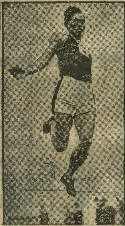
ROZWÓJ SPORTU W JAPONII

W Niemczech wzniesiono pierwszy pomnik sportowy, przedstawiający narciarza, który ludzko przypomina znany pomnik lotnika, dzieła polskiego rzeźbiarza Edwarda Wittiga.