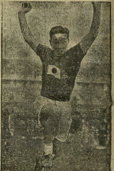
ROZWÓJ SPORTU W JAPONII

KOMUNALNA KASA OSZCZĘDNOŚCI MIASTA BYDGOSZCZY