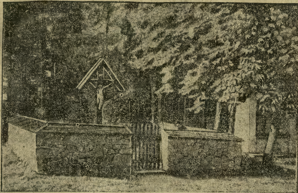
NA „DZIEŃ ZADUSZNY”

Uniwersytet oksfordzki promował na doktora praw synową króla angielskiego, księżniczkę Yorku.