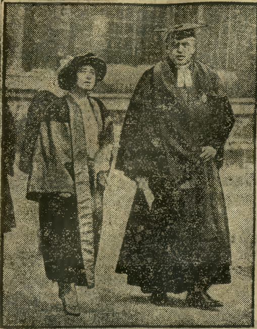
KSIĘŻNICZKA ANGIELSKA W TODZE DOKTORSKIEJ

Uniwersytet oksfordzki promował na doktora praw synową króla angielskiego, księżniczkę Yorku.