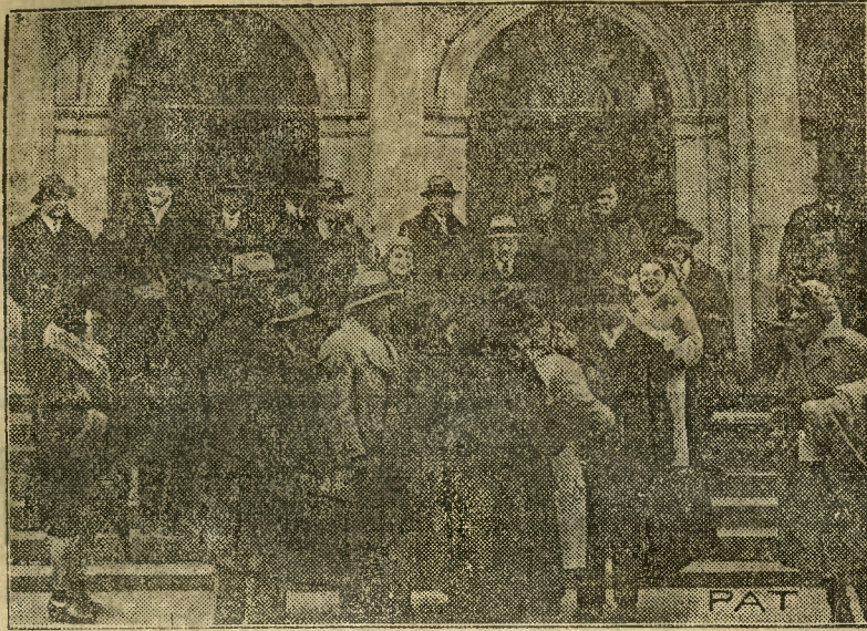
Do Warszawy przybyli lekarze jugosłowiańscy celem zapoznania się z urządzeniami sanitarnymi i szpitalami warszawskimi. Na zdjęciu chwila opuszczania dworca Głównego przez przybyłych lekarzy.